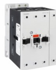
Stycznik mocy BF95